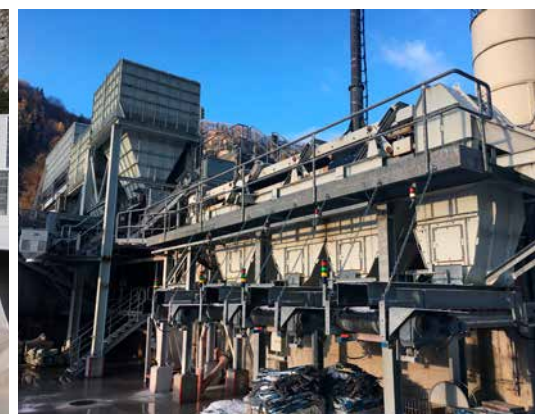
Zusätzlicher Waschgang vor der Big-Bag-Befüllung.

DoloSafe weist von der Gewinnung bis zur Abpackung bzw. Verladung eine konstante Qualitätssicherung auf. DoloSafe wird nach dem Brechen in einer eigenen Produktionsschiene mit reinem Weißenbacher Wasser mehrfach gewaschen, getrennt, gesiebt, sauber gelagert und umsichtig verpackt. Aus diesem Grund können wir für die Materialien die Reinheit ab Werk laut ÖNORM 1128 (2013) garantieren.