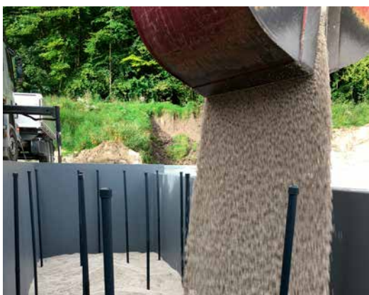
Befüllung mit LKW und Greiferarm