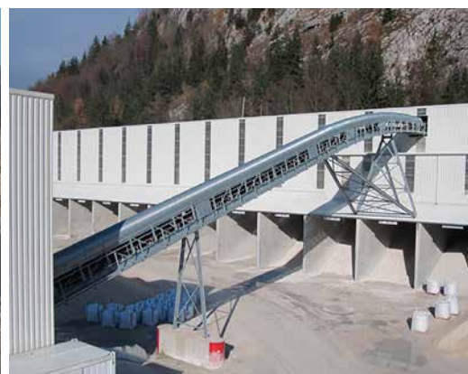
Brechen, Sieben und 2-faches Waschen in der modernen Aufbereitungsanlage.