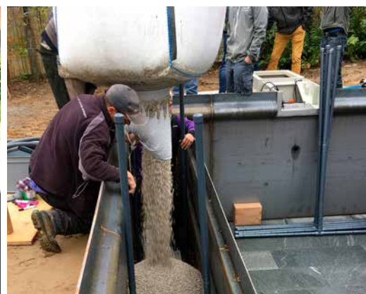
Befüllung aus dem BigBag