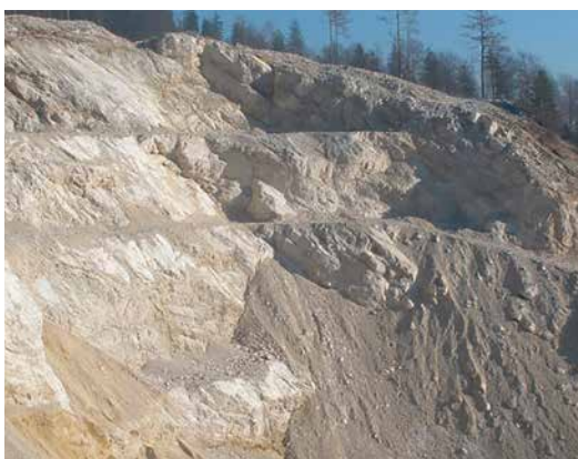
Die sondierten Abbauschichten im Steinbruch mit der besten Eignung.